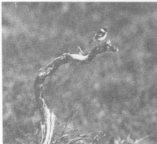
KUVA 3. Utsjoen mustapäätaskuhavain- to on maamme pohjoisin.

Havainnoijia kehoitetaan tekemään "höyhenentarkkoja" kuvauksia. Rotujen määrittämisestä ks. British Birds 6/77.