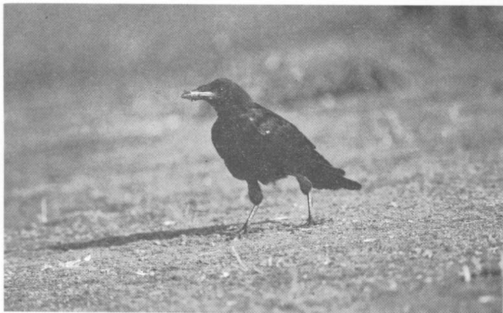
KUVA 4. Porin nokivaris. Huomaa nokan muoto ja mustavarikselle tyypillisten tuuheiden höyhenhousujen puuttuminen.