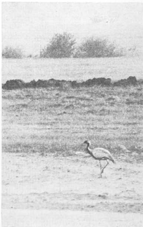
KUVA 1. Neitokurki Anthropoides virgo