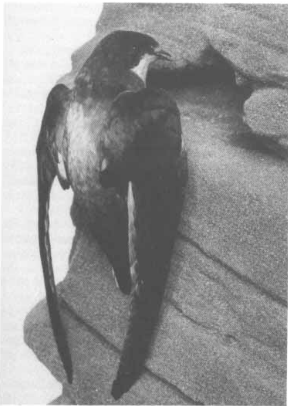
Piikkipyrstöpääsky ( Hirundapus caudacutus ), Helsingin Yliopiston kokoelmat.

Valkosiipikiuru M. leucoptera . 9. 6. 1971 Raippaluoto.