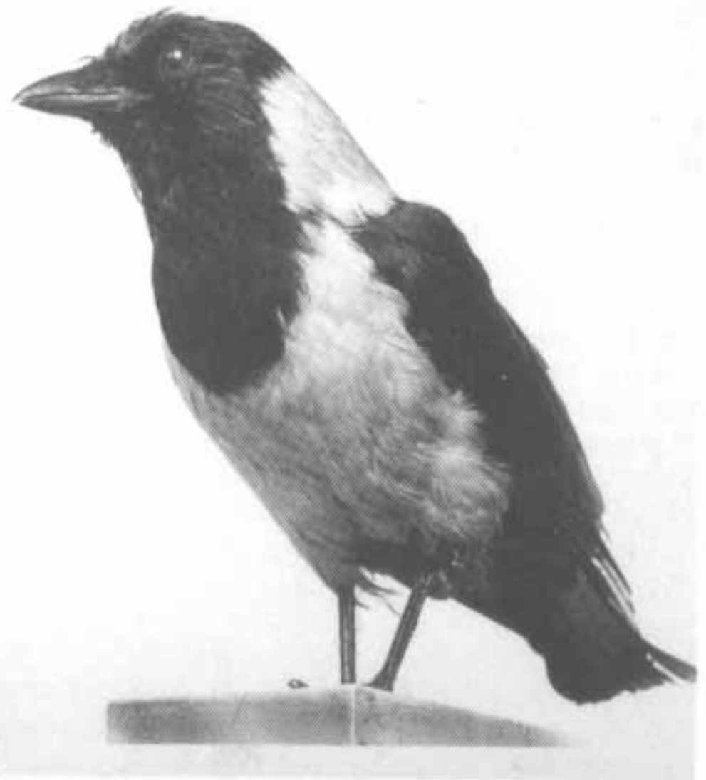
Siperiannaakka ( Corvus dauuricus ), Helsingin Yliopiston kokoelmat.

Karimetso Phalacrocorax aristotelis . 19. — 20. 12. 1949 Helsinki (OF 31:54). Linnun näkivät monet. Saadut kuvaukset olivat suppeita