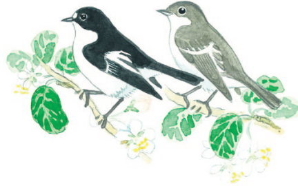
kirjosieppo svartvit flugsnappare

Räksäparvesta kuuluu jatkuvasti räkättävää juttelua. Parvi antaa hyvän suojan pesärosvoilta, joita emot jahtaavat yhteistuumin. Hyvä tuntomerkki on varsinkin lennossa näkyvä harmaa alaselkä.