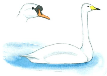
kyhmy- ja laulujoutsen knöl- och sångsvan

Upeat valkoiset linnut erottaa toisistaan ainakin nokan väristä: laulujoutsenella on keltainen, mustakärkinen nokka, kyhmyjoutsenella oranssi, mustatyvinen nokka. Laulujoutsenen voi nähdä koko maassa, kyhmyjoutsenen lähinnä merenrannoilla.