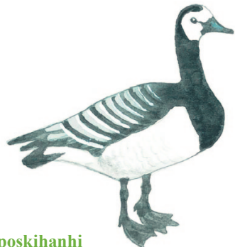
valkoposkihanhi vitkindad gås

Upeat valkoiset linnut erottaa toisistaan ainakin nokan väristä: laulujoutsenella on keltainen, mustakärkinen nokka, kyhmyjoutsenella oranssi, mustatyvinen nokka. Laulujoutsenen voi nähdä koko maassa, kyhmyjoutsenen lähinnä merenrannoilla.