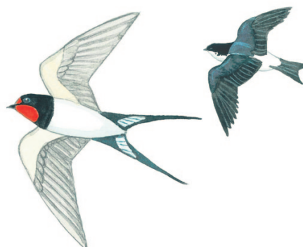
haara- ja räystäspääsky ladu- och hussvala

Tummat ja kaarevasiipiset ilmojen valtiat syövät, nukkuvat ja parittelevat ilmassa. Kirkuva srriiii -ääni kaikuu toukokuun loppula talojen seinistä ja julistaa kesän alkaneen.