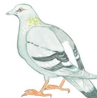
kesykyyhky eli pulu tamduva

Siroit ja keveät tiirat lentelevät väsymättömästi vesien yllä, leluttelevat paikoillaan tähyttämässä ja syöksyvät välillä alas pikkukalojen kimppuun. Kahta lajiamme, kala- ja lapintira, on melko vaikea erottaa toisistaan.