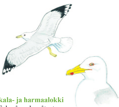
kala- ja harmaalokki fiskmåsar och gråtrut

Keväisten peltojen ensimmäisellä asuttajalla on nimensä mukaan töyhtö päälle. Helpommin hyypän tuntee kuitenkin lennossa leveistä, mustavalkoisista siivistä, ja naukuvasta, videopelimäisestä äänestä.