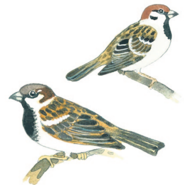
varpunen ja pikkugarpunen gråsparv och pilfink

Varsinainen jokapaikanhöylä viihtyy yhtä hyvin maalla ja kaupungissa ja kelpuuttaa ravinnoksi melkein mitä tahansa. Harmaatakki on hyvin älykäs ja osaa esimerkiksi kastaa kuivan leipäpalan veteen pehmenemään.