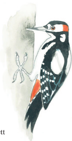
käpytikka större hackspett

Villien kalliokyyhkyjen kesyt sukulaiset viihtyvät erinomaisesti kaupungeissa, koska ruokaa on paljon ja petoja vähän, ja korkeat talot muistuttavat niiden alkuperäistä elinympäristöä, kalliojyrkänteitä.